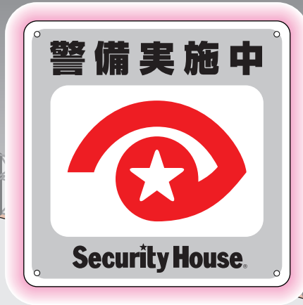
仮設足場対策用シート